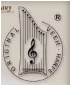
ヘルマンハーブ協会のロゴ (ホームページより転載)

ドイツで生まれ、高槻から日本に広まっているかわいいハーブです。「音楽のバリアフリー」といわれる軽やかで美しい音色をお聞きください。