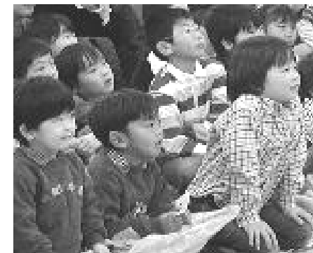
身を乗り出して見入る 高槻島本人形劇連絡会